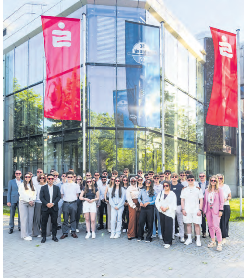
Text/Foto: Sparkasse Paderborn-Detmold-Höxter

Komm in unser Team und gestalte die Zukunft mit – für dich und deine Region!