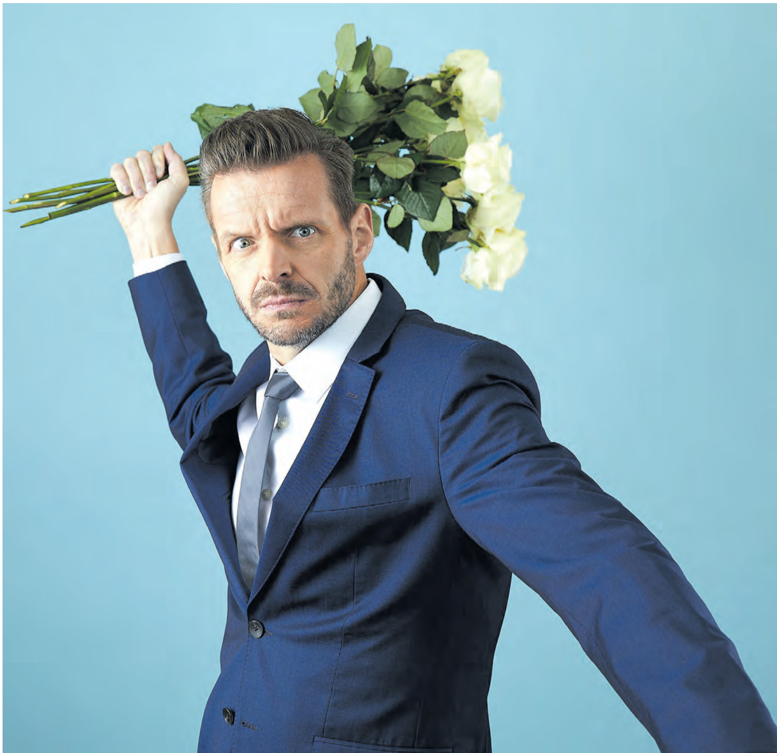
„Endlich glücklich“: Florian Schroeder gastiert mit seinem aktuellen Bühnenprogramm im Detmolder Sommertheater.

Kabarettist Florian Schroeder ist am 21. Mai im Detmolder Sommertheater