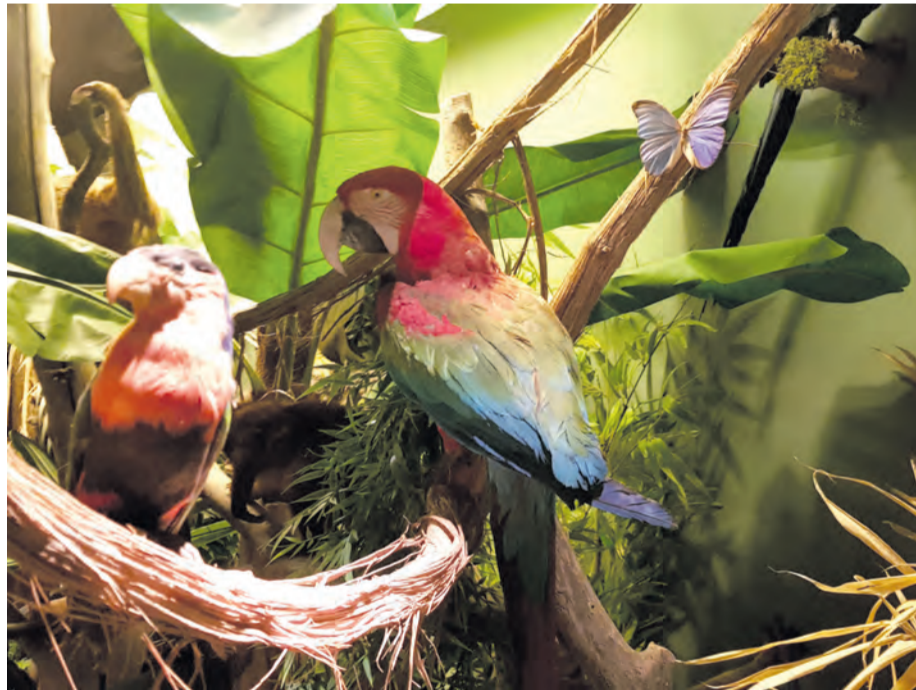
Bunte Vögel und tropische Regenwälder mitten in Detmold.

entstehen ließen. Ein außergewöhnliches Exponat sorgt dabei für besondere Aufmerksamkeit: eine 5,40 Meter lange Blitzröhre aus der Senne. Entstanden durch einen gewaltigen Blitzschlag, verschmolz der Sand unter extremer Hitze zu einer glasartigen Röhre. Bis heute gilt sie als die weltweit längste Blitzröhre im montierten Zustand und fasziniert große wie kleine Besucher. Die Naturkunde-Abteilung verbindet Wissen und Erlebnis auf anschauliche Weise und macht den Museumsbesuch zu einer abwechslungsreichen Entdeckungsreise. Gerade am langen Pfingstweekende bietet das Lippische Landesmuseum damit ein ideales, wetterunabhängiges Ausflugsziel für Familien und eine kleine Weltreise direkt vor der Haustür. Geöffnet ist das Lippische Landesmuseum von Montag bis Freitag von 10 bis 18 Uhr und am Samstag, Sonntag sowie Pfingstmontag von 11 bis 18 Uhr. (lwz)