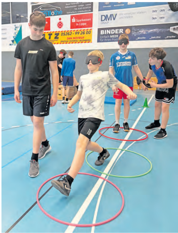
Mit voller Konzentration durch den Parcours: Die Schüler probieren selbst aus, wie anspruchsvoll Rollstuhlsport ist.

In jeweils zwei Doppelstunden konnten die Klassenstufen fünf bis zehn aktiv in die Welt des inklusiven Sports eintauchen, und dabei vor allem eines erleben: Perspektivwechsel durch eigene Erfahrung. Im Mittelpunkt standen praktische Übungen, bei denen die Kinder und Jugendlichen selbst aktiv wurden. Beim Rollstuhlsport absolvierten sie zunächst einen Parcours, um ein Gefühl für das Fahren zu entwickeln. Anschließend erprobten sie grundlegende Fahrtechniken sowie erste Ballübungen im Rollstuhlbasketball. Schnell wurde deutlich, wie viel Koordination, Kraft und Konzentration notwendig sind, um sich sicher im Rollstuhl zu bewegen und gleichzeitig ein Spiel zu gestalten. Ein weiterer Schwerpunkt lag auf dem Blinden- und Sehbehindertensport. In