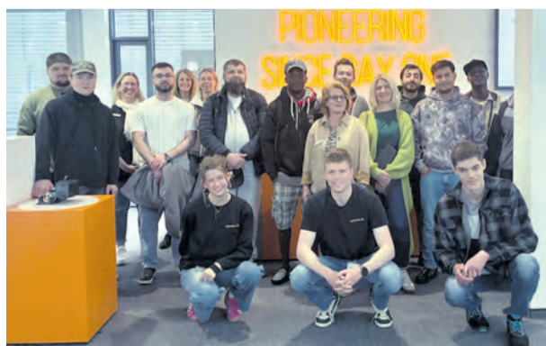
Wertvolle Einblicke in die Arbeitswelt gewonnen: Teilnehmer und Mitarbeiter von Jobcenter und Weidmüller bei der Veranstaltung „Der Funke springt über“.

Mit passgenauen Bildungsangeboten des Jobcenters könnten sich nun konkrete Perspektiven für Ausbildung und Qualifizierung eröffnen. Nach der gelungenen Premiere steht für alle Beteiligten jedenfalls fest: „Dieses Veranstaltungsformat hat Zukunft.“ (lwz)