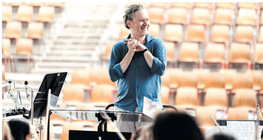
Im Zentrum des Festivals steht NWD-Chefdirigent Jonathan Bloxham, der in den Kammerkonzerten zugleich zu seinen Wurzeln als Cellist zurückkehrt.

Neben Einzeltickets für alle Veranstaltungen bietet die NWD für ihr „Klassik zu Pfingsten“-Festival weitere Konditionen für das Gesamtabonnement an. Tickets erhalten Interessierte an der Tourist-Information im Kurgastzentrum Bad Salzuffen (05222/9525200), bei der NWD-Geschäftsstelle in Herford (05221/98380) und online via Reservix. (lwz)