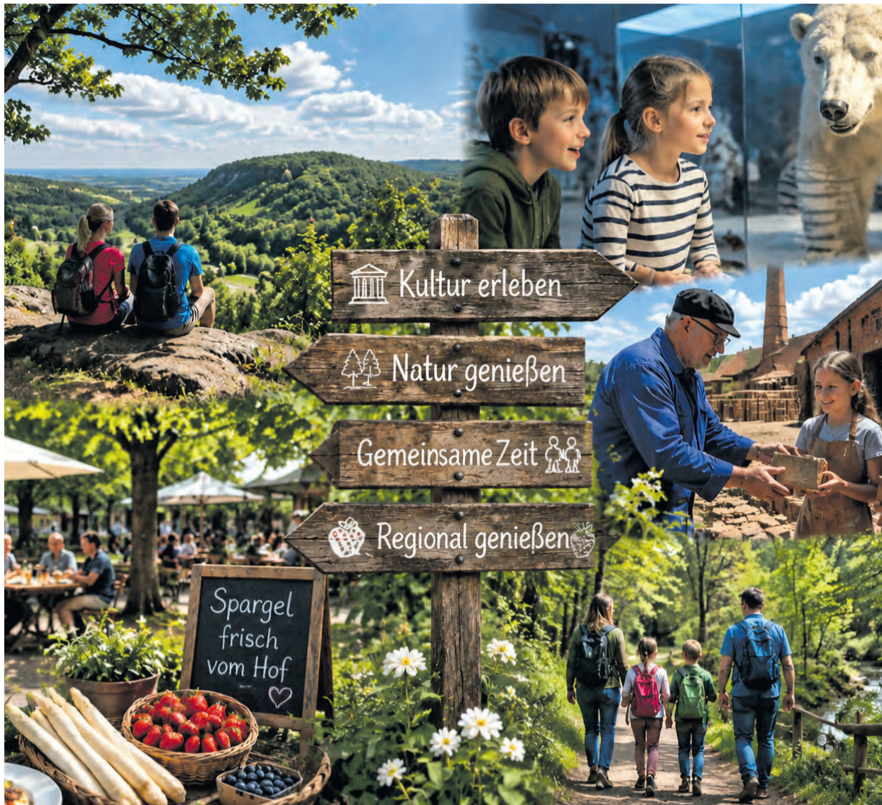
Pfingsten im Kreis Lippe: Familien genießen Wandern im Teutoburger Wald, Besuche in Museen und Spargelhöfen sowie kulinarische Erlebnisse in der Region.

Pfingsten in und um Lippe bietet Naturerlebnisse, Museen, Familienaktionen und regionalen Genuss