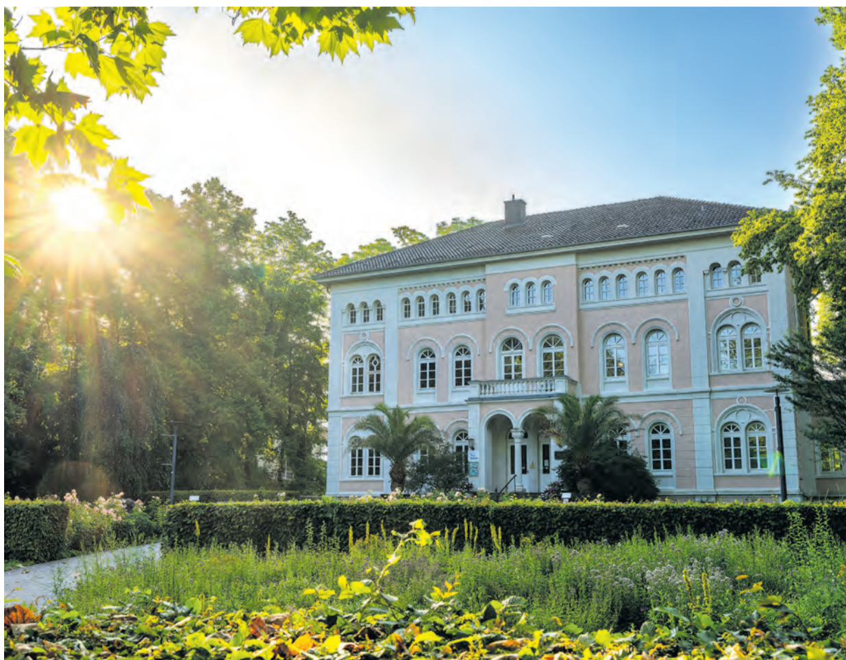
Der Arminiuspark in Bad Lippspringe lädt besonders zu Pfingsten zu ausgiebigen Spaziergängen ein.