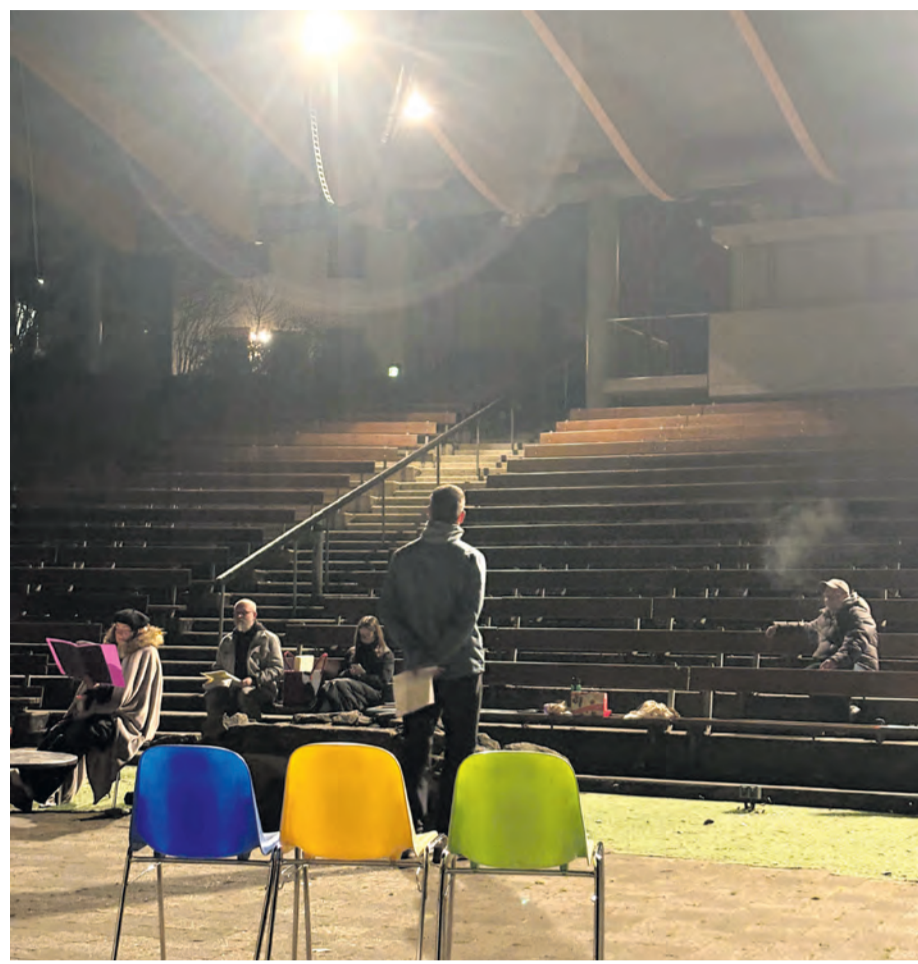
Die Darsteller der Freilichtbühne Bellenberg proben schon fleißig für den Start in die neue Saison.

Freilichtbühne Bellenberg startet mit Premiere und Neubau in die 77. Saison