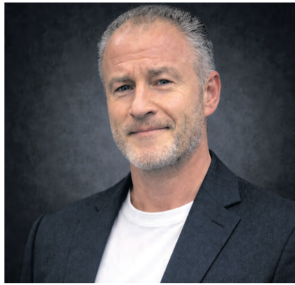
Energieexperte und Geschäftsführer der Solibra System Montage GmbH.

Ergänzend bieten wir ein asset-basiertes Direktinvestment. Anleger erwerben hierbei ein konkretes Element der Energieinfra-