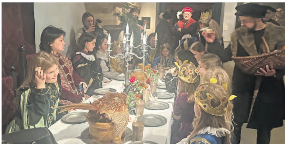
Beim „DiMiDo-Ferienstpaß“ im Weserrenaissance-Museum Schloss Brake steht das Mitmachprogramm „Fürstlich feiern auf der Speisekarte“.

sich die Kids passend dazu auf eine Spurensuche und findet plötzlich eine Spindel oder andere Requisiten aus dem Märchen. Immer wieder donnerstags startet um 15 Uhr eine spannende Erlebnisführung mit dem Titel „Von Rittern und Burgen“. Hierbei erfahren die Teilnehmer nicht nur jede Menge spannende Geschichten von tapferen Rittern, reizenden Prinzessinnen und ihren Abenteuern, sondern dürfen sich im Anschluss sogar ein Schauturnier nachspielen. Auf Wunsch kann man sich bei allen drei Angeboten auch verkleiden. Das Museum verfügt über einen großen Fundus an nachgeschneiderten Renaissance-Kostümen. Der „DiMiDo-Ferienstpaß“ findet mit freundlicher Unterstützung des Förderkreises des Museums statt. Dazu zählen die Lippische Landesbrandversicherung AG und die Sparkasse Lemgo. (lwz)