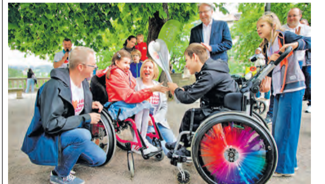
Die Fackel des „Kinder-Lebens-Laufes“ wird am 3. Juni in Detmold übergeben.

Interessierte sind eingeladen, an der öffentlichen Veranstaltung teilzunehmen und sich über die Kinderhospizarbeit zu informieren. Die Aktion soll Aufmerksamkeit für die Situation und betroffene Familien schaffen sowie Raum für Begegnung und Austausch bieten. Am 24. Juni wird die Fackel schließlich zum Kinderhospiz Bethel nach Bielefeld gebracht, wo ihre Reise weitergeht.