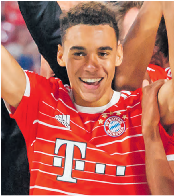
Das Zauberduo „Wusiala“: Die Hoffnungen der deutschen Fans ruhen vor allem auf den Schultern von Jamal Musiala (links) und Florian Wirtz.

Mit 48 Ländern nehmen so viele Teilnehmer wie noch nie an dem Turnier teil und messen sich in insgesamt 104 Spielen (alle auf Magenta TV zu sehen; zusätzlich 30 live in der ARD und 30 live im ZDF). Unter diesen Mannschaften sind auch Jordanien, Usbekistan, Kap Verde sowie der deutsche Gruppengegner Curaçao, die alle bei dem Turnier ihre WM-Premiere feiern. Insgesamt nehmen 16 Mannschaften aus Europa, zehn aus Afrika, neun aus Asien und Australien, sechs aus Südamerika, sechs aus