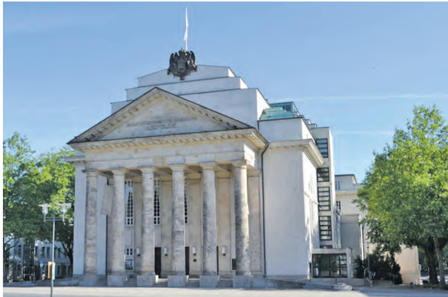
Die neue Spielzeit im Landestheater Detmold startet im August.