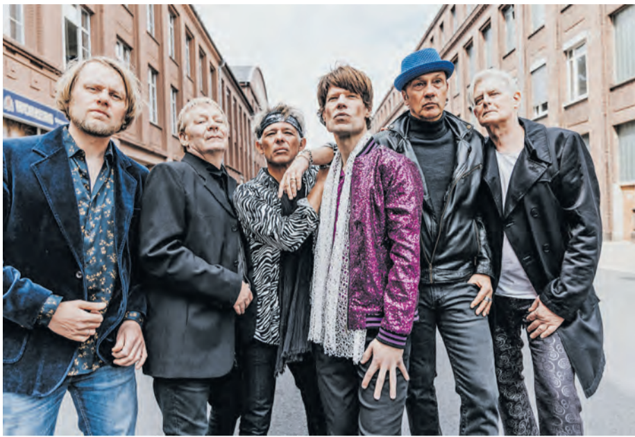
Das „Kurparkfest“ 2026 lockt am Samstagabend mit dem Auftritt der Rolling-Stones-Coverband „Voodoo Lounge“ an die Konzertmuschel im Kurpark.