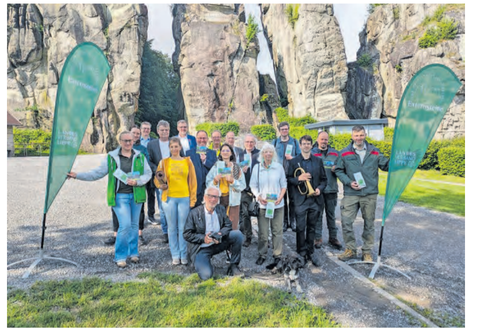
Die Kooperationspartner und Sponsoren laden an diesem Samstag, 27. Juni, gemeinsam zum Familienfest „Waldgeflüster“ an die Externsteine ein: Biologische Station Lippe e.V. mit Naturfoto AG, BUND Lippe, Detmolder Kammerorchester, Landesverband Lippe, Lippische Landesbrandversicherung, NABU/Rolfscher Hof, Naturpark Teutoburger Wald/Eggegebirge, Schutzgemeinschaft Externsteine e.V., Sparkasse Lemgo, Sparkasse Paderborn-Detmold-Höxter und Yoga Vidya e.V.

schluss bildet von 18 bis 19 Uhr ein Konzert des DKO Brass, einem Ensemble des Detmolder Kammerorchesters. Direkt vor der imposanten Kulisse der Externsteine erwartet die Gäste eine musikalische Reise, die von barocker Meisterkunst über Werke von George Bizet und Astor Piazzolla bis hin zu Filmmusik aus „Fluch der Karibik“ reicht. Die Besucher sind eingeladen, es sich auf mitgebrachten Picknickdecken auf der Wiese bequem zu machen und den Tag stimmungsvoll ausklingen zu lassen.