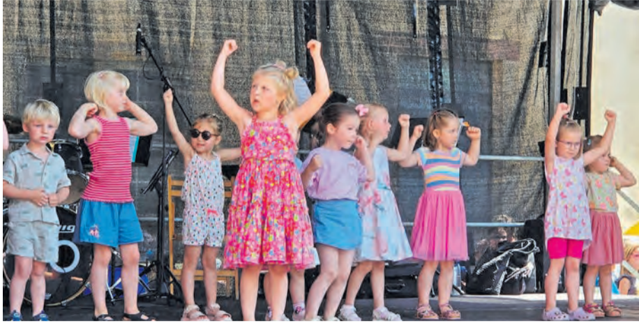
Die Kleinen haben großen Spaß: Auftritt des „Tanztreffs Hey“, der inzwischen unter dem Namen „by Hey“ bekannt ist.

„Tag der Weserrenaissance“ begeistert trotz Hitze mit Mitmachaktionen und Bühnenprogramm