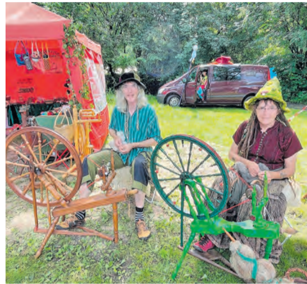
Diese beiden urigen Teilnehmer nennen sich „Hexenfilz“. Sie spinnen nicht nur ihre eigene Wolle, sondern verkaufen auch witzige Dinge wie Spüllappen und Rückenkratzer aus ihrem Material.

Im Laufe des Tages verbesserte sich die Situation: Ab Mittag füllte sich das Gelände zunehmend. Kulinarische Angebote erwiesen sich dabei einmal mehr als verlässlicher Publikumsmagnet. Ob Erbsensuppe, Kaffee und Kuchen oder Spezialitäten aus dem Mittelmeerraum – das gastronomische Angebot lockte zahlreiche Besucher an und sorgte trotz aller Einschränkungen für eine lebendige Atmosphäre.