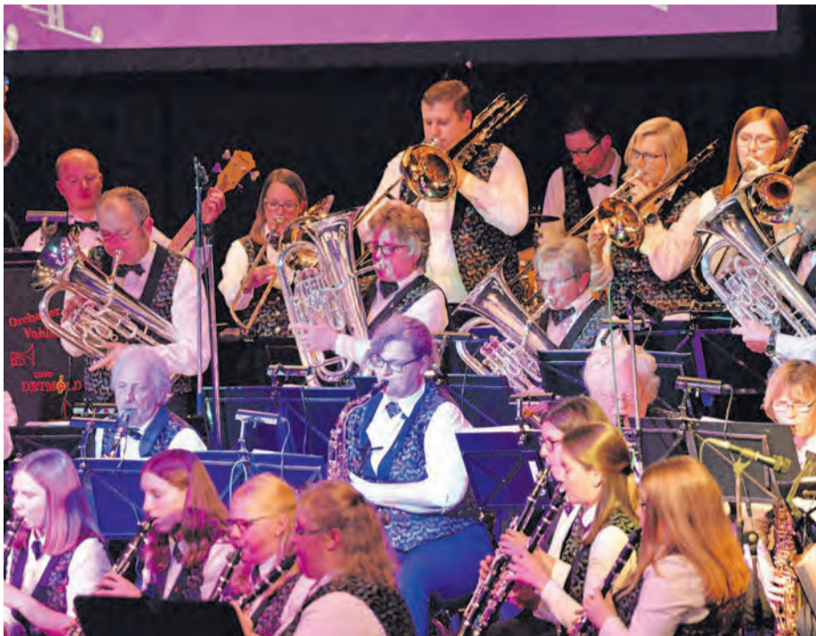
Das Orchester Vahlhausen bringt seinen beliebten Bigband-Sound zum Sommerkonzert in den K(ult)urpark Holzhausen-Externsteine.

Orchester Vahlhausen tritt in Holzhausen-Externsteine auf – Open-Air-Konzert mit Bigband-Sound