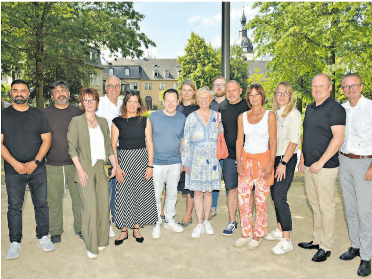
Die Werbegemeinschaft Detmold „Die Händler“ lädt zum Wein- und Genussfest in den Schlossgarten ein.

Kreis Lippe. Mehrere vermummte Personen, mutmaßlich aus dem Umfeld der „Identitären Bewegung“, verschafften sich am vergangenen Sonntag, 21. Juni, gegen 11 Uhr unbefugten Zugang zum Hermannsdenkmal in Detmold, stiegen hinauf, zündeten Pyrotechnik und entrollten Banner. Die Gruppe floh, ein 21-Jähriger aus der Schweiz blieb, kletterte gesichert weiter und stieg erst gegen 17 Uhr selbstständig vom Denkmal herab. Der Staatsschutz ermittelt gegen ihn nun unter anderem wegen Hausfriedensbruchs, Verdacht auf Volksverhetzung und dem Abbrennen illegaler Pyrotechnik.