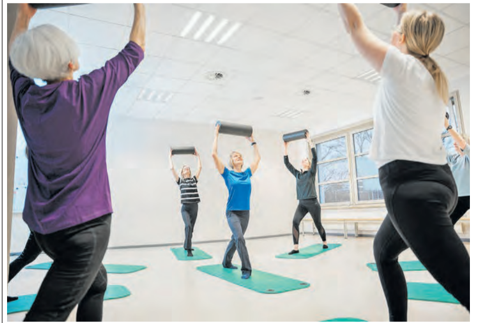
Fit und gesund durch Herbst und Winter mit den Kursen des Gesundheitswerks Bad Salzuflen.