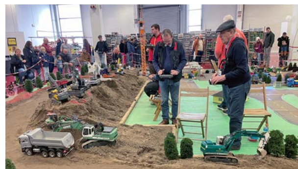
Treffpunkt für große und kleine Modellbau-Fans auf der „Deine Messe“ in Bad Salzuflen: die „Lipper Modellbautage“ in der sehr gut besuchten Halle 22.1.

Ein weiterer Publikumsmagnet war wie eigentlich in jedem Jahr die Hochzeitsmesse (Halle 22.2), die am Samstag und Sonntag wie gewohnt zahlreiche Gäste anzog und mit ihrem vielfältigen Angebot erneut zu den unbestrittenen Höhepunkten der gesamten Veranstaltung zählte.