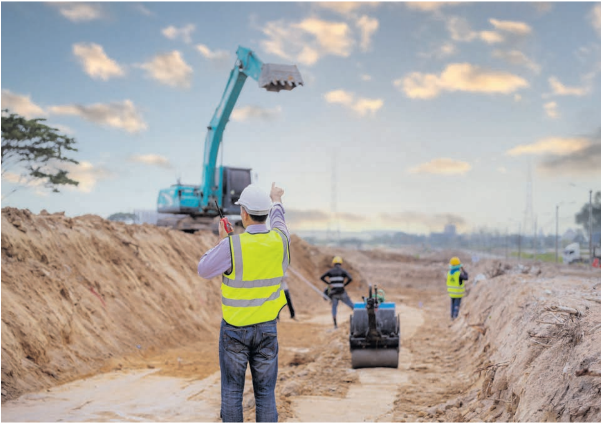
Fachkräfte im Tief- und Straßenbau arbeiten vor allem an Bauprojekten unter und auf der Erdoberfläche.

Die Ausbildung im Tief- und Straßenbau ist in der Regel eine duale Berufsausbildung und dauert drei Jahre. Sie findet parallel im Ausbildungsbetrieb und in der Berufsschule