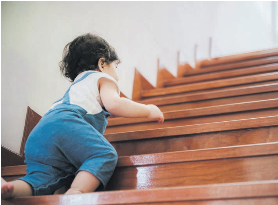
Gut gebaute, sichere Treppen geben Halt, schon für die Kleinsten.

findet hier ein anspruchsvolles Tätigkeitsfeld. Gute Treppenbauer sind gefragt. Individuelle Bauweise, Sanierungen im Bestand und der Wunsch nach hochwertigen, langlebigen Lösungen sorgen für eine stabile Nachfrage. Mit wachsender Erfahrung können Treppenbauer leitende Aufgaben übernehmen, sich selbstständig machen oder sich auf besondere Bereiche wie Design-Treppen, Denkmalschutz oder CNC-Fertigung spezialisieren. (lwz)